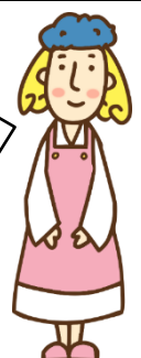
いいな・まこせんせい

長与町の子育て情報をたくさん掲載しています！ 左のQRコードから、ぜひご覧ください！