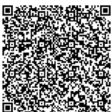
ミックンの絵本も ぜひ読んでね♪