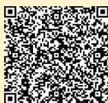
はじめての子育て