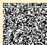
2人目からの子育て